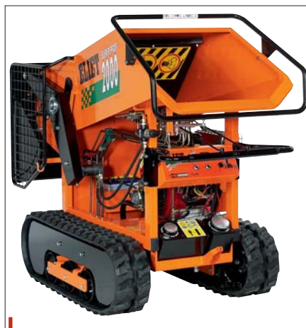
Mobilní štěpkovače jsou použitelné prakticky kdekoli

ních štěpkovačů jedničkou na trhu,“ upřesňuje šéf Agrocaru. Mobilní štěpkovače mají mnoho předností. Jsou použitelné kdekoli a lze se s nimi dostat prakticky na jakoukoliv